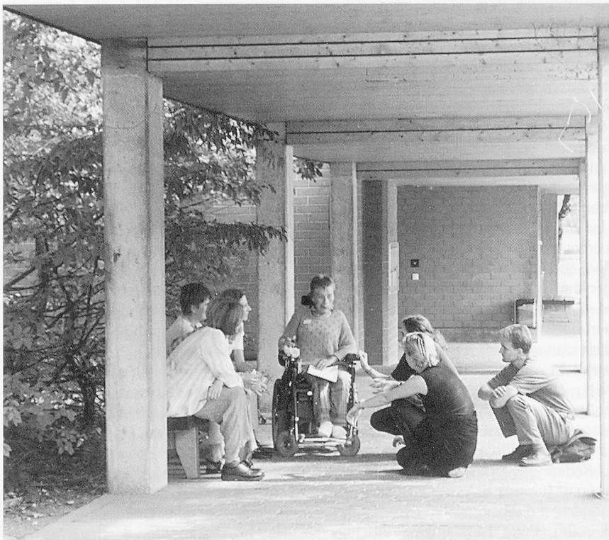
Angeregter Gedankenaustausch im Pausenhof des Schulheims für körperbehinderte Kinder in Aarau.

In vielen Fällen sei intensive Beziehungsarbeit nötig, damit man das nötige «Gschpüri» für ein Kind entwickle, fand eine Therapeutin in einer Arbeitsgruppe. Die Beziehungsarbeit beanspruche oft einen grossen Teil ihrer Therapiestunden, was bei ihr gelegentlich Schuldgefühle auslöse. – Eine gute Beziehung ist die Basis für fruchtbare Zusammenarbeit, entgegnete ihr eine Berufskollegin. Allerdings: Wenn man bedenkt, dass ein Kind im Laufe eines Schultages mindestens zehn Beziehungen pflegt beziehungsweise pflegen muss, kann man leicht nachvollziehen, dass sich dieses Kind nicht auf alle Bezugspersonen gleichermaßen einlassen kann und will. Möglicherweise ist die grosse Zahl der Bezugspersonen nämlich ganz einfach eine Überforderung. – Brigitte Schaub erlebt es zwar