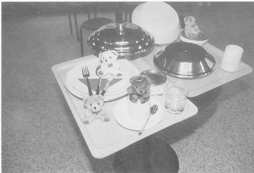
Etwas fürs Gemüt am Stand der Berndorf.

chen Speisenverteilung bietet Berndorf systematisierte Lösungen. Ihr neuestes Produkt ist der «Re-Caldo-Trolley». Dieser Trolley ist zugleich Transportwagen, Kühlschrank und Regenerationsgerät für schockgekühlte Mahlzeiten. Damit der bakteriologisch kritische Bereich von mehr als 10 Grad Celsius auch bei längeren Transportwegen ohne Stromanschluss nie erreicht wird, verfügt der Trolley über einen Isolationsschutz, der drei Stunden zu überbrücken vermag. Auf der Zieletage oder -station der Institution kann der Trolley, wieder «am Strom», so programmiert werden, dass die Menüs «auf die Minute genau» servierbereit sind. Die Erwärmung erfolgt mit Induktionswärme (durch elektronische Erzeugung eines Magnetfeldes). Neben Produkten der «kalten Linie», die eine zeit- und raumverschobene Produktion ermöglicht, bietet Berndorf auch Produkte für die traditionelle «warme Linie» an.