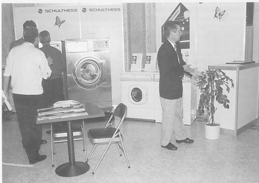
Beratung und Information für spezifische Probleme.

«Einer für alles», dies das Motto der Berndorf Luzern AG aus Littau: «Vom Verteilband über die Transportwägel zu den Tablettis und Clochen bis hin zum Porzellan, dem Besteck und den Gläsern», für jede Herausforderung in Sa-