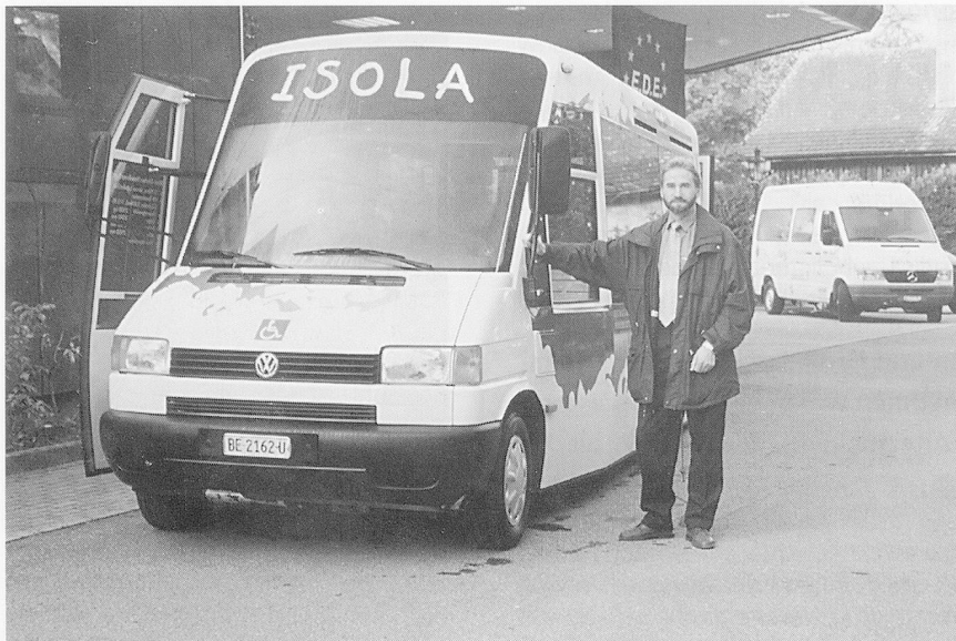
Die «ISOLA» des regionalen Alters- und Pflegeheims Frenkenbündten, Liestal.

derfreundlich konzipiert, und sie verfügen über eine ausgereifte Mikroprozessorensteuerung, die den individuellen Bedürfnissen des Betriebes angepasst werden kann. Auch der Umweltschutz liegt dem Unternehmen am Herzen: Die Wassermenge kann neu individuell, je nach Art und Menge des Spülgutes, eingestellt werden (4 bis 14 Liter). Nicht nur herkömmliche Steckbecken und Urinflaschen, sondern auch anderes schwieriges Spülgut, zum Beispiel Mandolinen- oder Keilbecken, werden in den Spülautomaten einwandfrei gereinigt.