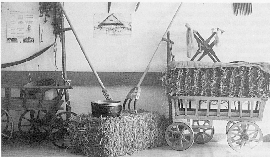
Erlebnisgastronomie in einem «ganz gewöhnlichen» Speisesaal.