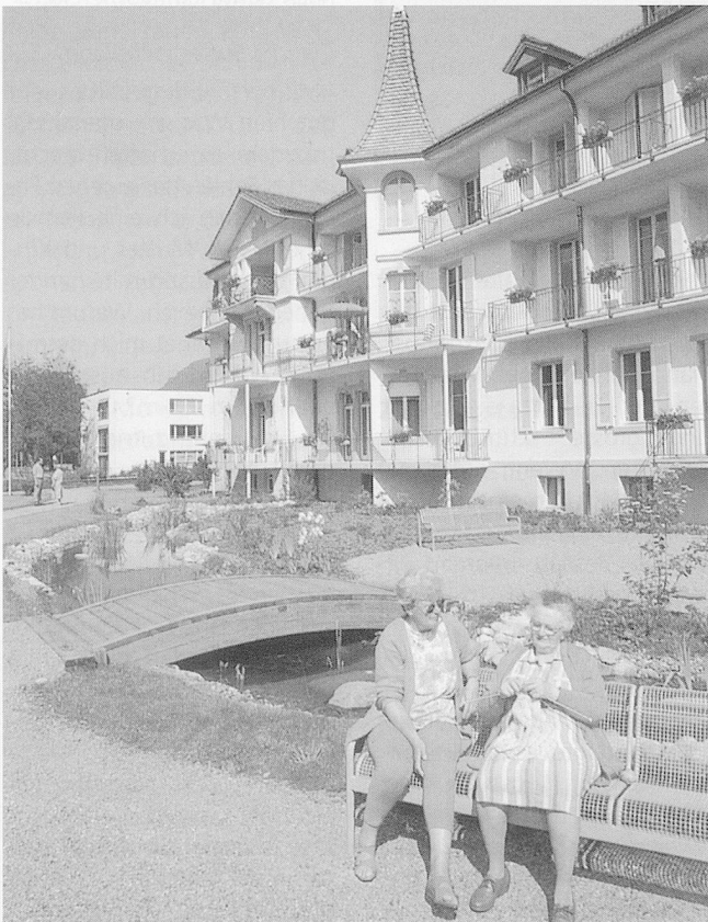
Das renovierte «Türmlihuus» mit 41 Heimzimmern.

Was sich ursprünglich fast zufällig aus der Lage im Ferienort ergeben hatte, ist heute bewusstes Konzept: Feriengäste, die kommen und gehen, bringen ein Stück Aussenwelt ins Heim. Die Zimmer für Heimbewohner und Hotelgäste befinden sich in je eigenen Gebäuden. Gemeinsam sind der Speisesaal, die Cafeteria, der Andachtsraum und die Mehrzweckräume. Sie ermöglichen Begegnungen zwischen Jung und Alt, Hotelgästen und Heimbewohnern. Dem gleichen Zweck dienen die öffentlichen Veranstaltungen, die von beiden Benutzergruppen und weiteren Gästen besucht werden. ■