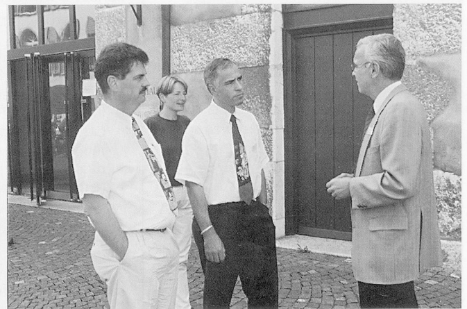
Zuhören ... und ausdiskutieren, jedes zu seiner Zeit.