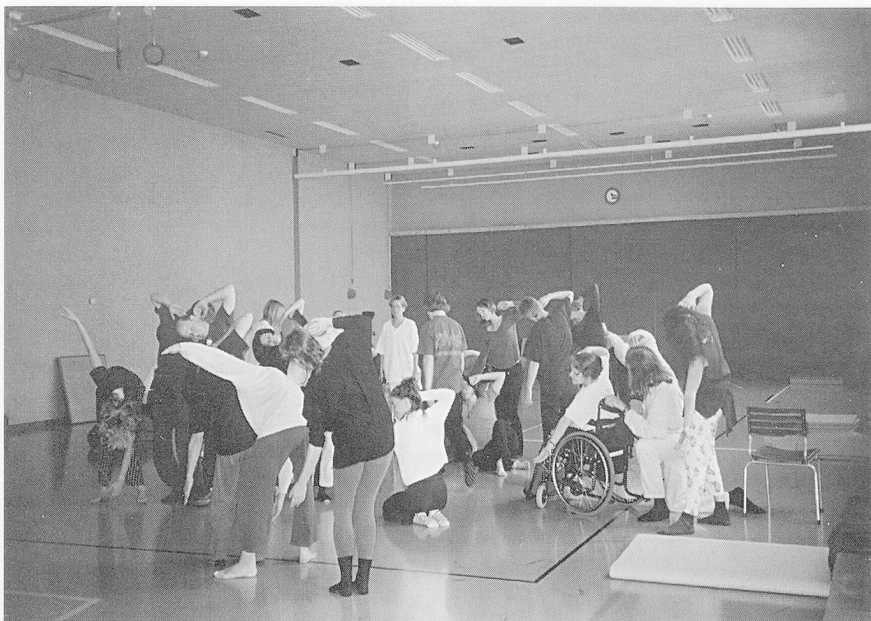
Konzentrierte Arbeit im DanceAbility-Workshop.