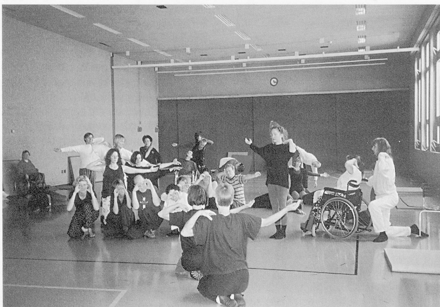
DanceAbility heisst, die persönliche Bewegungssprache und den eigenen künstlerischen Ausdruck im Tanz zu erforschen.

Nater: Eine gute Durchmischung von Menschen mit sichtbarer und solchen mit nicht sichtbarer Behinderung ist von Vorteil. Bisher haben an unseren «BewegGrund»-Kursen keine Menschen mit einer geistigen Behinderung teilgenommen. Natürlich wäre das möglich, man müsste jedoch das Programm anders gestalten und die Themen anders angehen.