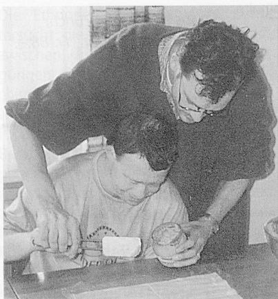
Eine Verbesserung der Handhabung von Utensilien.

Das Wohnheim Ungarbühl ist eine private Stiftung, die schulentlassenen Menschen mit einer geistigen oder mehrfachen Behinderung langfristige Wohnplätze, Tagesaufenthalte und Ferienplätze anbietet. Die Bewohnerinnen und Bewohner sind zwischen 20 und 60 Jahre alt. Rund die Hälfte von ihnen geht einer Arbeit in der Eingliederungswerkstatt Schaffhausen nach, die andere Hälfte ist heimintern in den Wohngruppen oder den Aktivierungsbereichen Ton, Holz und Gestalten beschäftigt.