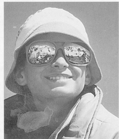
Ein Stück Himmel...

Weshalb fragen wir im sozialpädagogischen Alltag so oft «Wo gab's Probleme?» – statt «Was ist gut gelaufen?» Beobachtungshefte sind voll von Problembeschreibungen, Notizen über erfreuliche Dinge haben Seltenheitswert. Weshalb wohl? Wir sind uns sehr daran gewöhnt, uns mit den negativen Seiten des Lebens herumzuschlagen, ja wir identifizieren uns mit einem Beruf, der es mit Problemen zu tun hat. Die Entscheidung für «lösungsorientiertes Arbeiten» ist deshalb oft verbunden mit einem echten Perspektivenwechsel: Wir kämpfen nicht gegen den Schatten, sondern für das Licht! Dies können wir nur in einer wirklich positiven Gesinnung und einer zutiefst positiven Haltung dem Kind gegenüber. Wo uns der Mut fehlt, dieses Positive zu suchen, gerade neben und in allen Schwierigkeiten und Verhaltensstörungen, ist lösungsorientiertes Arbeiten nicht möglich. Der lö-