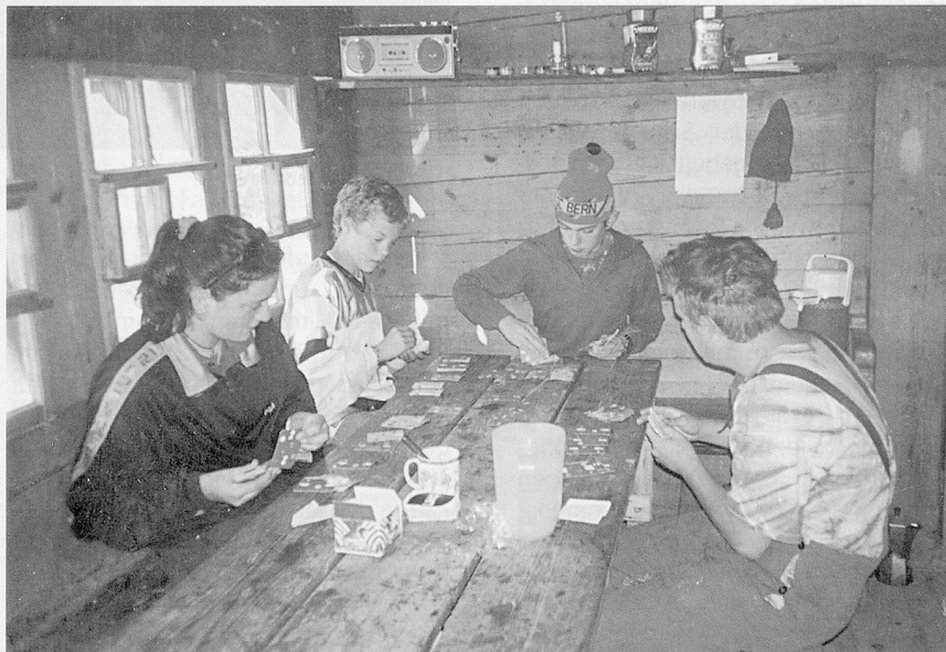
Hüttenalltag: Notwendige Arbeiten – verweilen und spielen.