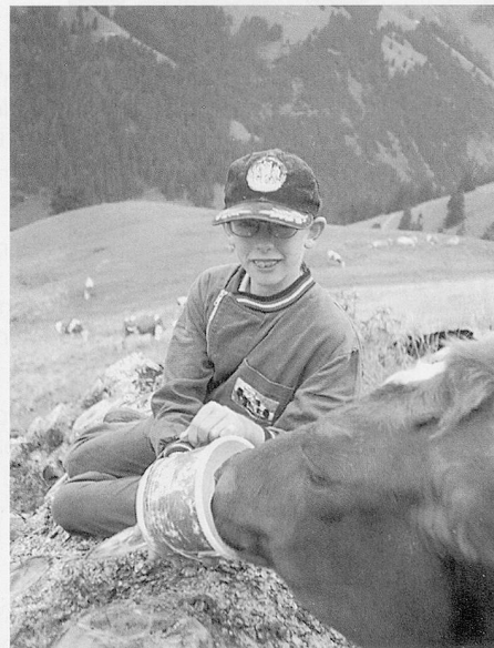
Schule: Im Stall und in der Natur ergeben sich ungewohnte Lernthemen.