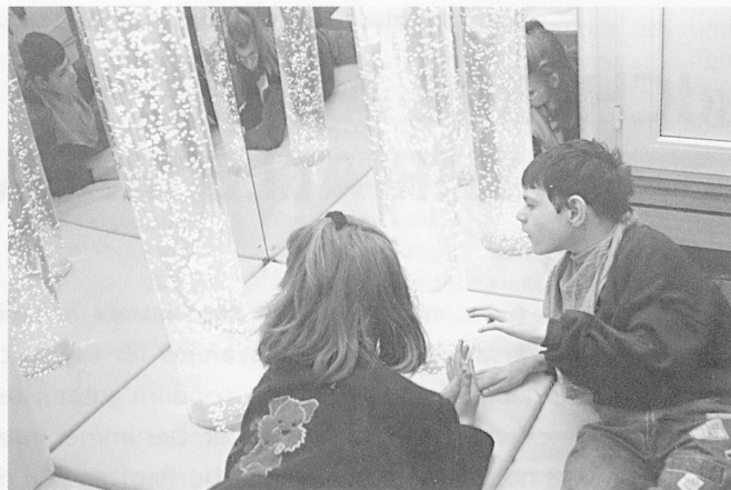
Snoezelen: Jeder kann tun und lassen, was er will, ob im Bällchenbad oder beim «Baden» in Licht, Farben und Musik.

gerichtet werden. Die Bewohnerinnen und Bewohner können sich da auf angenehme Weise von der Behandlung durch den Physiotherapeuten entspannen.