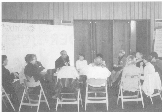
Intensive Diskussionen bei den Workshops.