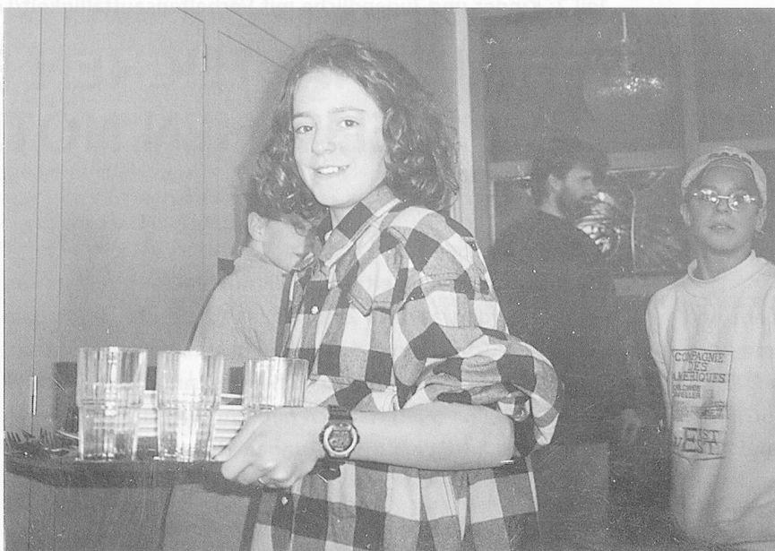
Küchendienst nach dem gemeinsamen Mittagessen: Schülerinnen und Schüler der «Langhalde».

Lareida: Man wird weiterhin nach neuen Formen der Betreuung, Bildung und Erziehung suchen. Ambulante Dienste, Tageskliniken und ähnliches werden wohl an Bedeutung zunehmen. Aber auch stationäre Institutionen werden gebraucht. Zwischen diesen verschiedenen Formen der Betreuung wird sich ein Konkurrenzdenken entwickeln, was in einem gewissen Masse wünschenswert ist, andererseits im Zusammenhang mit wirtschaftlichen Veränderungen aber auch Hektik und Verunsicherung verursacht. Dies kann lähmend wirken und dadurch der Arbeit abträglich sein. Vermehrte Zusammenarbeit wäre erstrebenswert.