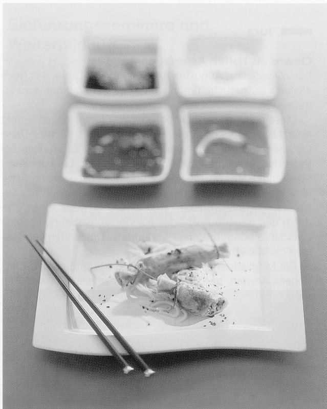
Das kreative und trendige Hotelporzellan von Villeroy & Boch hilft Akzente zu setzen und sich mit speziellen Angeboten zu profilieren.

Die Berndorf Luzern AG erweitert ihr Angebot im Bereich Gastronomie und Speiseverteilung. Per 1. Mai 2002 werden neben der Marke Bauscher neu auch die Hotelporzellan-Produkte von Villeroy & Boch angeboten.