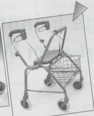
Rollator Modell WK018 Inkl. Sitz, Korb, pannensiche- rer Bereifung und gepolsterter Rückenlehne. Farbe blau. Preis: Fr. 300.20 inkl. MwSt.

Aktuelle Aktionen immer unter www.gloorrehab.ch !