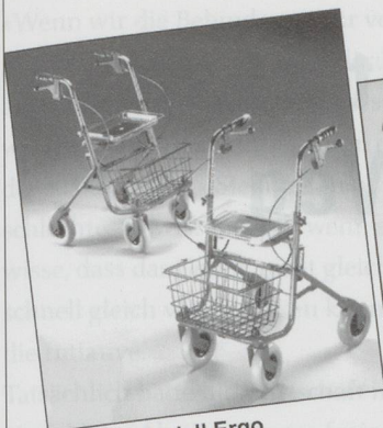
Rollator Modell Ergo Inkl. Sitz, Korb und pannensicherer Bereifung. Farbe rot oder blau. Preis: Fr. 297.20 inkl. MwSt.