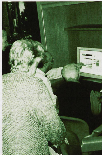
Dabeisein, besonders wenn eine fachkundige Person für Instruktionen zur Verfügung steht.

Die zwei Internetstationen bestehen aus zwei PCs Pentium 4 mit je einem