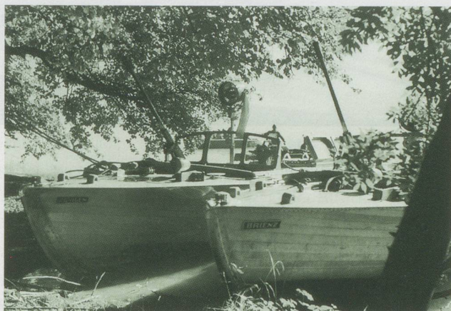
In Deckung ...

Das hiess umlernen, neu lernen und sich in einem Gelände zurecht finden, das so anders war als der gewohnt feste Boden unter den Füßen.