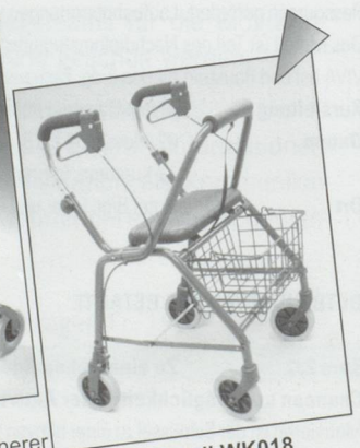
Rollator Modell WK018 Inkl. Sitz, Korb, pannensicherer Bereifung und gepolsterter Rückenlehne. Farbe blau. Preis: Fr. 300.20 inkl. MwSt.

Aktuelle Aktionen immer unter www.gloorrehab.ch !