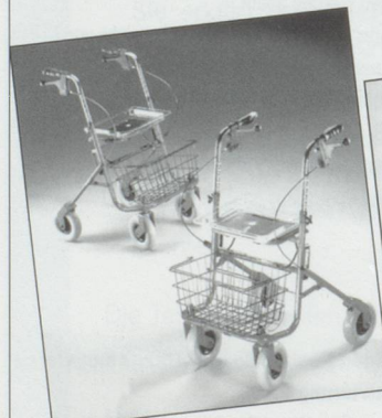
Rollator Modell Ergo Inkl. Sitz, Korb und pannensicherer Bereifung. Farbe rot oder blau. Preis: Fr. 297.20 inkl. MwSt.

Aktuelle Aktionen immer unter www.gloorrehab.ch !