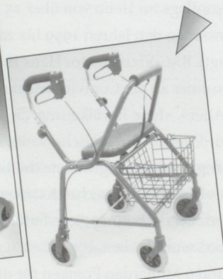
Rollator Modell WK018

Aktuelle Aktionen immer unter www.gloorrehab.ch !