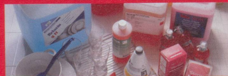
Reinigung und Pflege