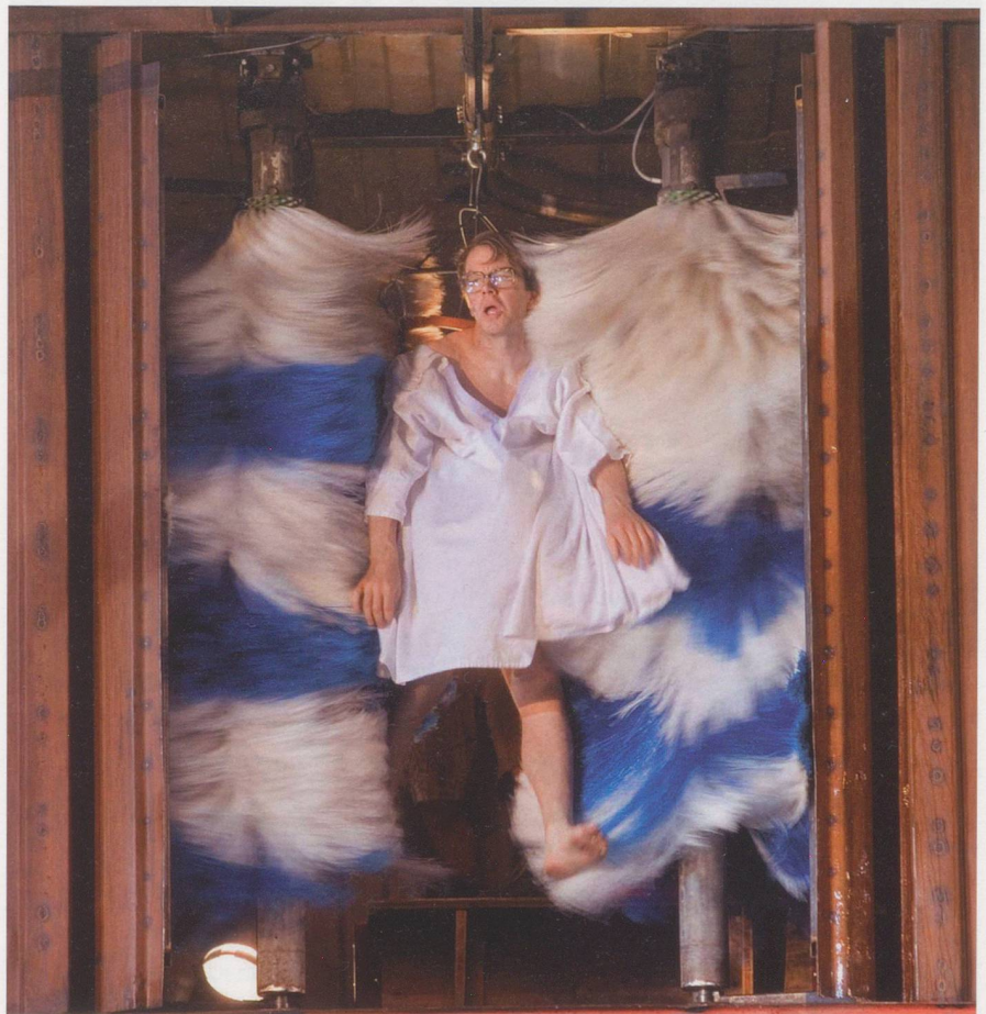
Waschen, Essen und Schlafen im «Silo 8» funktionieren rationalisiert und optimiert.

■ Ganz konkret: Wo würden Sie Abstriche machen bei der Bewohnerbetreuung?