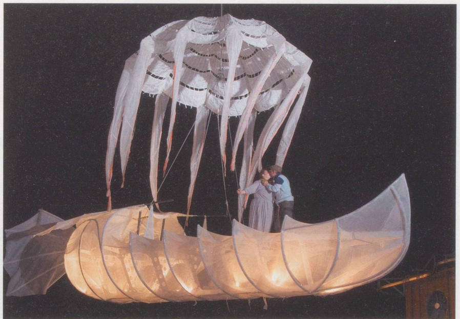
Am Ende siegen Kreativität und Phantasie über das rücksichtslose Streben nach Effizienz.

verschiedentlich Hochkonjunktoren von Technokratisierungswellen gab. Doch immer hat sich die Erkenntnis durchgesetzt, dass der Mensch nicht so rationell bewirtschaftet werden kann. Kommt noch hinzu, dass sich die Menschen auch wehren. Namentlich Betagte und ihre Angehörigen haben auch Macht, da sie ein Stimmrecht haben. Das ist gut, denn das führt dazu, dass sich Politiker über ihre