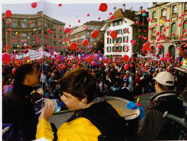
Die Transparente sind inzwischen eingerollt, die Wachsamkeit ist geblieben: Demonstration gegen die NFA im Oktober 2004 auf dem Berner Bundesplatz.