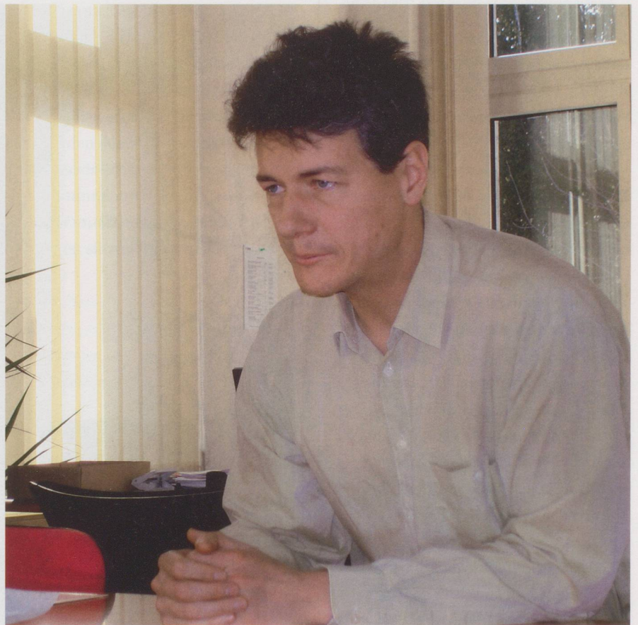
Unbezahlte Heimrechnungen sind im Kanton Genf, laut Ankers, keine Seltenheit mehr.

Ankers: Immer mehr Leute können oder wollen ihre Heimrechnung nicht bezahlen. Das Problem sind nicht die wirklich Armen, sie erhalten so viele Ergänzungsleistungen wie nötig, und die echten Reichen kommen für die Kosten auf. Schwierig ist es vor allem mit Leuten, die zum Beispiel ihr Haus in Spanien vor zehn Jahren den Kindern vermacht haben. Früher ist in solchen Fällen einfach der Kanton