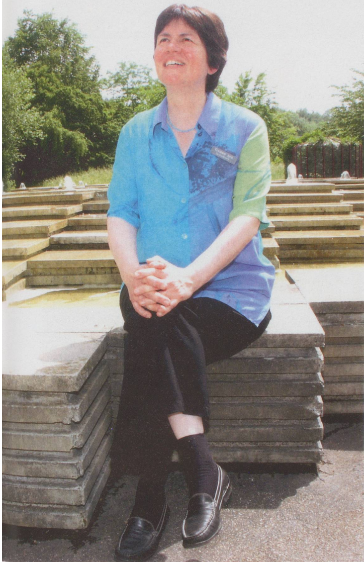
«Rituale helfen bei den Übergängen zwischen Leben und Tod.»

ihrer Arbeit selten den klassischen Verlauf des Sterbeprozesses, wie ihn die Forscherin Elisabeth Kübler Ross beschrieben hat. Dennoch ist die Pfarrerin erstaunt darüber, wie schwer kranke Menschen nach anfänglichem Auflehnen schliesslich ihre Situation annehmen und eine positive Lebensbilanz ziehen. Oft ist es die Seelsorgerin, die eine Brücke zur besseren Akzeptanz des Todes schlagen kann.