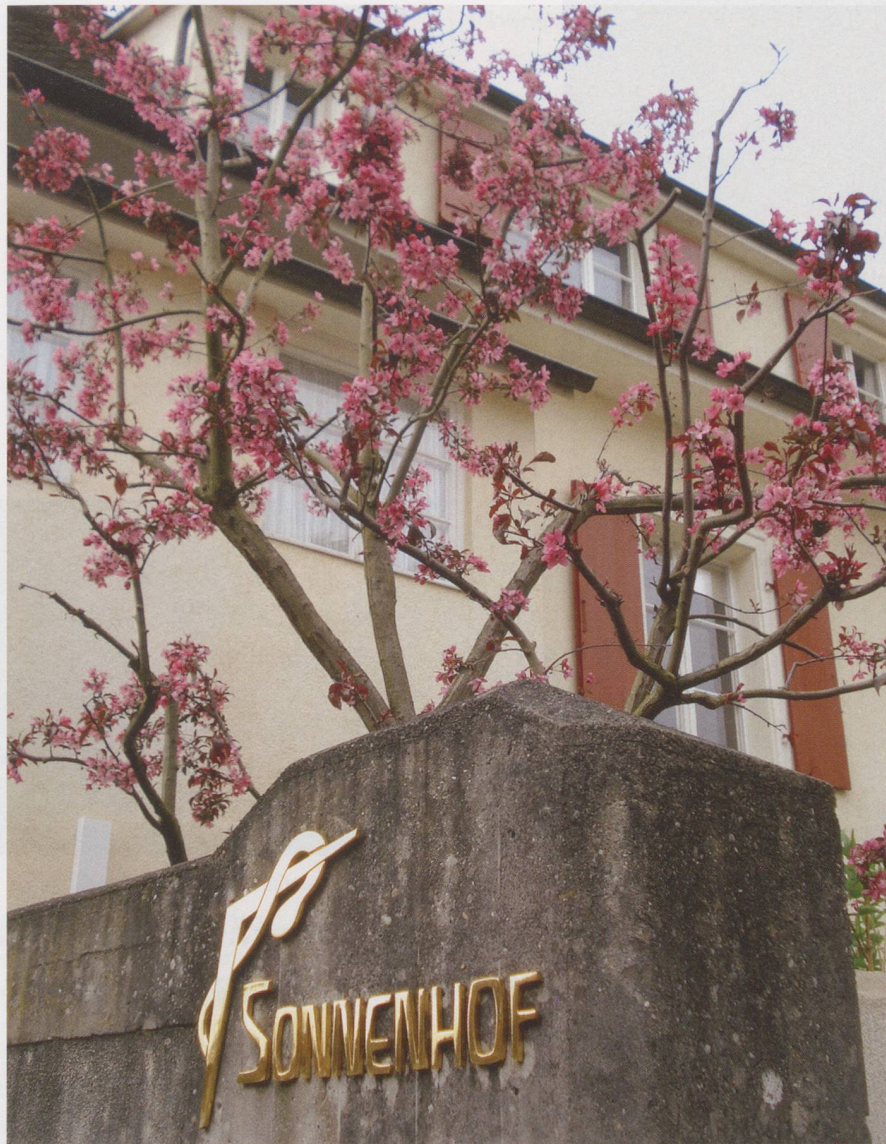
Im «Sonnenhof» in Arlesheim werden auch weiterhin Bewohnerinnen und Bewohner mit herausforderndem Verhalten betreut.

Simons Schicksal hat alle Beteiligten stark beschäftigt und in der Region einen Lernprozess ausgelöst. Der «Sonnenhof» Arlesheim, der sich über Jahre hinweg um Simon bemühte und