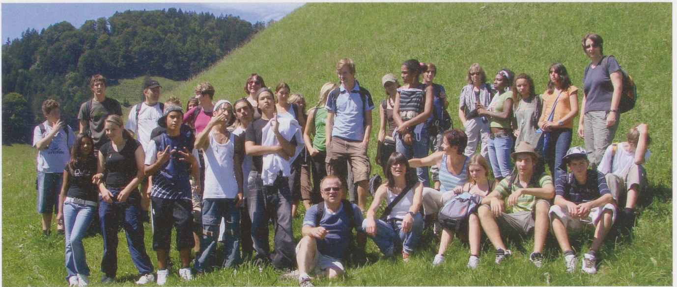
Aus der Wohngruppe in die Natur: Jugendliche und Betreuende auf einem Ausflug.

zeigt, dass die Befürchtung, das klar strukturierte Vorgehen könnte das zwischenmenschliche Klima trüben, unbegründet sei. «Dass ganz klar ist, welche Fragen beantwortet und welche Informationen beschafft werden sollen, bedeutet noch lange nicht, dass im Gespräch keine Empathie und kein Fingerspitzengefühl mehr gefragt sind. Im Gegenteil: Einfühlungsvermögen und Menschenkenntnis bleiben zentral