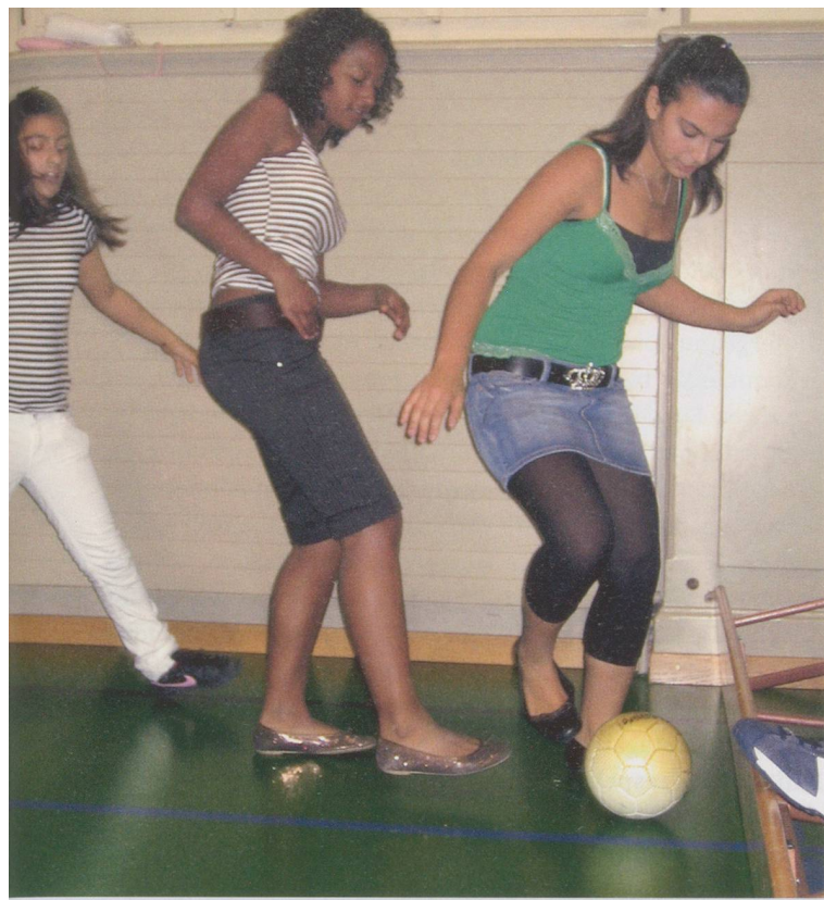
Samstagabend in der Turnhalle: Das Styling muss stimmen.