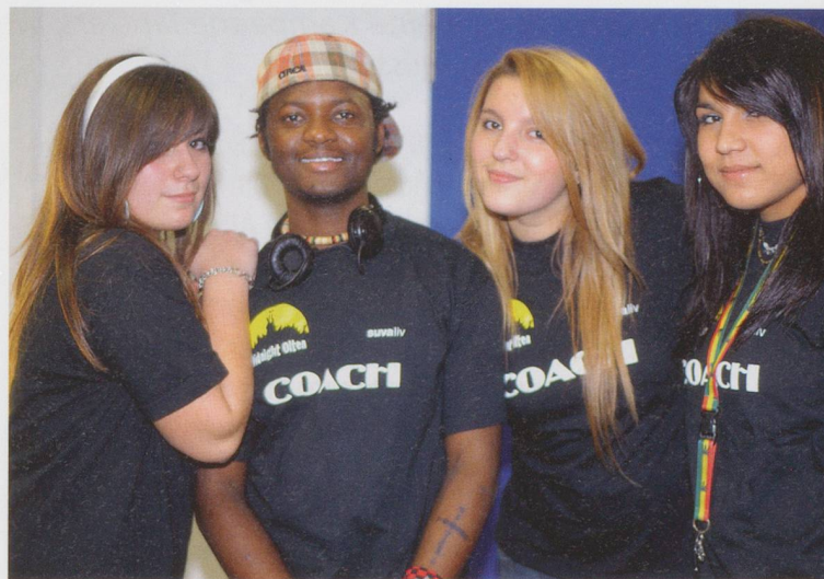
Jugendliche Coachs sorgen dafür, dass alles friedlich abläuft.