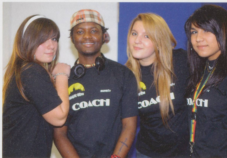
Jugendliche Coachs sorgen dafür, dass alles friedlich abläuft.