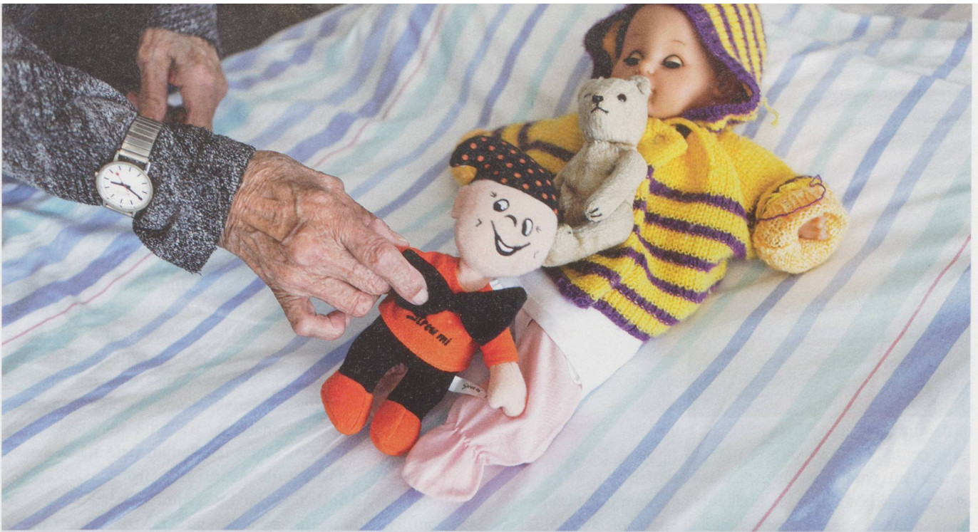
Über die eigene Hinfälligkeit lachen: Wer würdig altern will, muss die Angst loswerden – das schafft man am besten mit Humor.