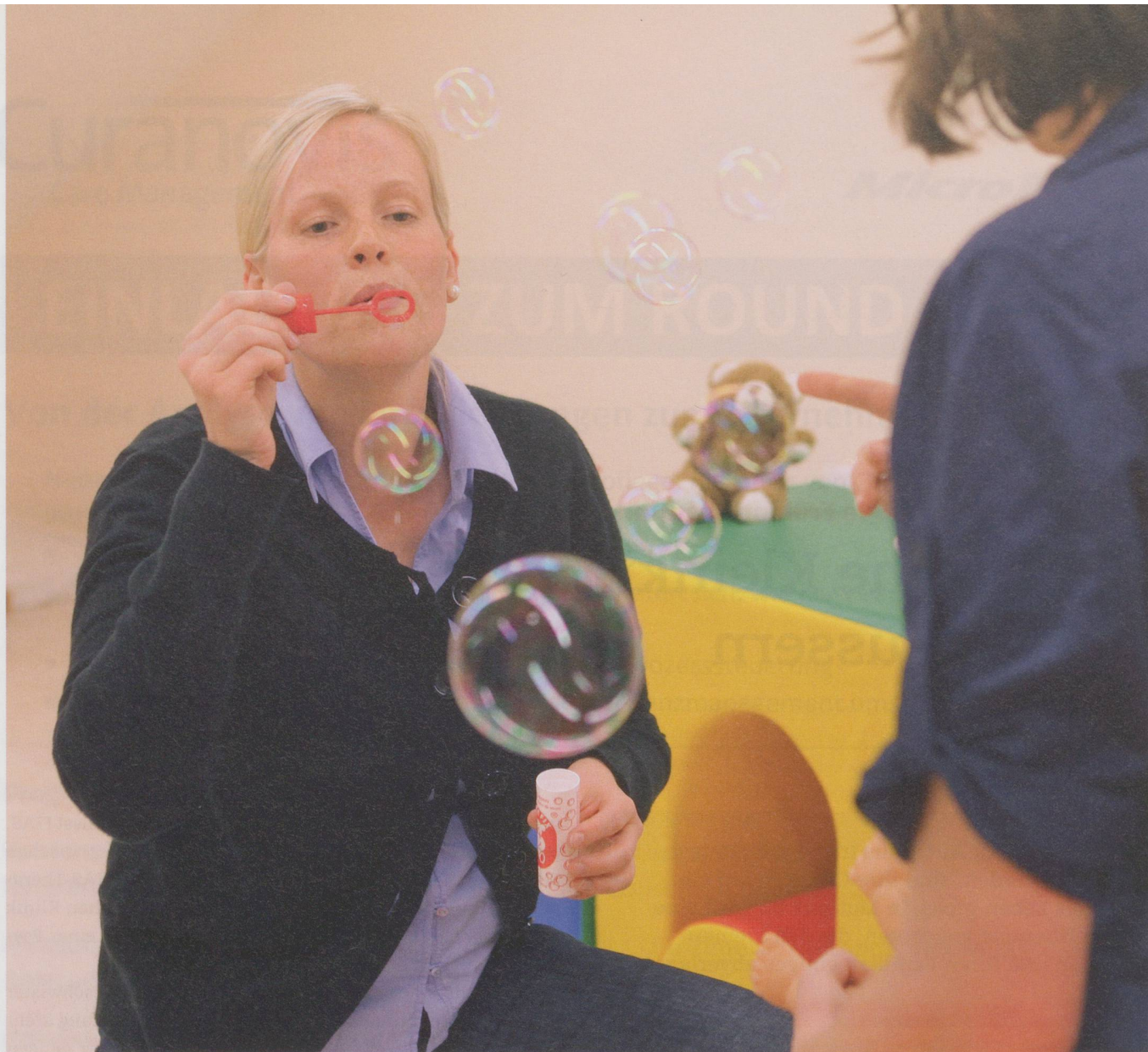
Kontaktaufnahme mit Seifenblasen: Während des Spiels stehen Kind und Spielpartner unter therapeutischer Beobachtung.