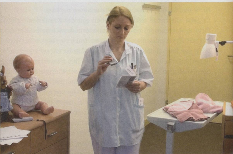
Nach jeder Verrichtung zieht die Mitarbeiterin den Scanner, den Bewohner- und den Leistungskatalog aus der Tasche ...