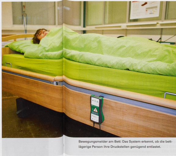
Bewegungsmelder am Bett: Das System erkennt, ob die bettlägerige Person ihre Druckstellen genügend entlastet.

Und so funktioniert der Bewegungsmelder: Die Messeinheit ist bei Dekubitusgefährdeten Personen unter der Matratze fixiert und sowohl mit dem Displaygerät am Bettrand als auch mit einer Lichtrufanlage verbunden. Der Mobility Monitor zeigt im Ampelsystem, wie mobil die bettlägerige Person gegenwärtig ist. So erhält das Pflegepersonal Informationen, um das Dekubitusrisiko richtig einzuschätzen und unnötige physische Belastungen beim Umlagern zu vermeiden. Denn oft ist nicht ganz klar, ob die Menschen überhaupt umgelagert werden müssen. Gerade nachts ist es besser, den Schlaf nicht unnötig zu stören. Sollte eine Umlagerung nötig sein, ist das System gemäss den Presseunterlagen auch fähig, daran zu erinnern. Und es warnt die Pflegenden via