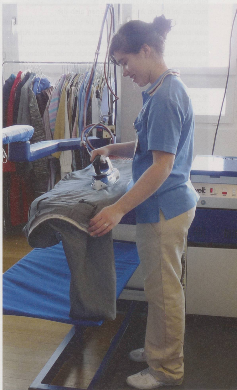
Blaue Shirts für die Hauswirtschaftsmitarbeiterinnen in den Stadtzürcher Pflegeheimen: «Identifikation mit dem Betrieb.»