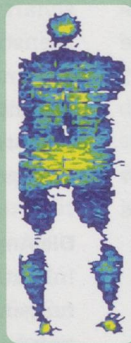
Druckmessung Trio-Cell Plus