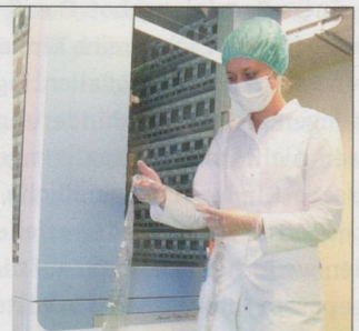
Die Mitarbeiterin der Adler-Apotheke vor der Blister-Maschine.

Adler-Blister – so einfach gehts: Patientinnen und Patienten laden das Gesundheitsdatenblatt von der Website der Adler-Apotheke Winterthur herunter, füllen es aus und schicken dieses zusammen mit einem ärztlichen Rezept an die Apotheke. Die Blister kommen dann per Post. Mehr Infos: www.adlerblister.ch