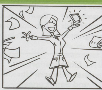
Dank careCoach ...