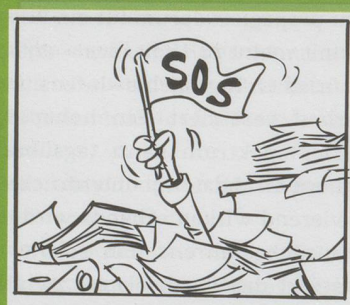
Doku Überflutung ?