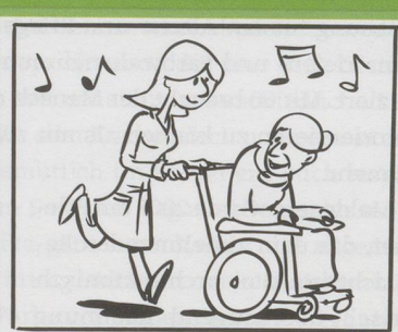
... Zeit für's Wesentliche !