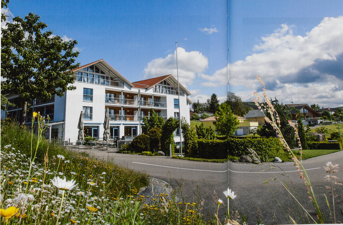
Wohn- und Pflegeheim Sonnmatt im schaffhausischen Wilchingen: «Händeringend auf der Suche nach einer qualifizierten Ausbildungsverantwortlichen.»