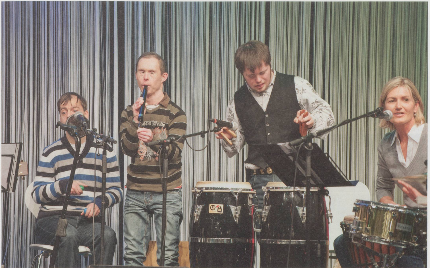
«Sich am ganz Normalen orientieren, zum Beispiel am Feiern – das ist Inklusion»: Die «Weidliband» an der «Swiss Handicap» 2013.