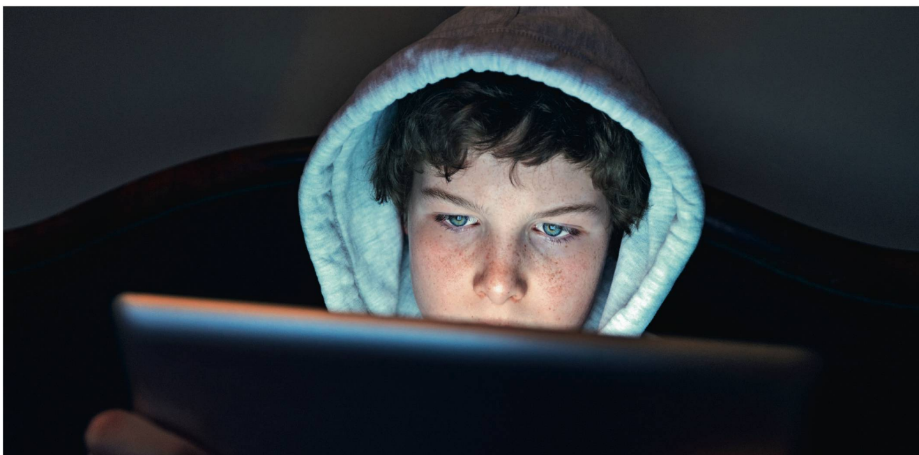
Jugendlicher vor einem LCD-Flachbildschirm. Wer sich abends dem blauen Licht aussetzt, verschiebt den Schlaf nach hinten.