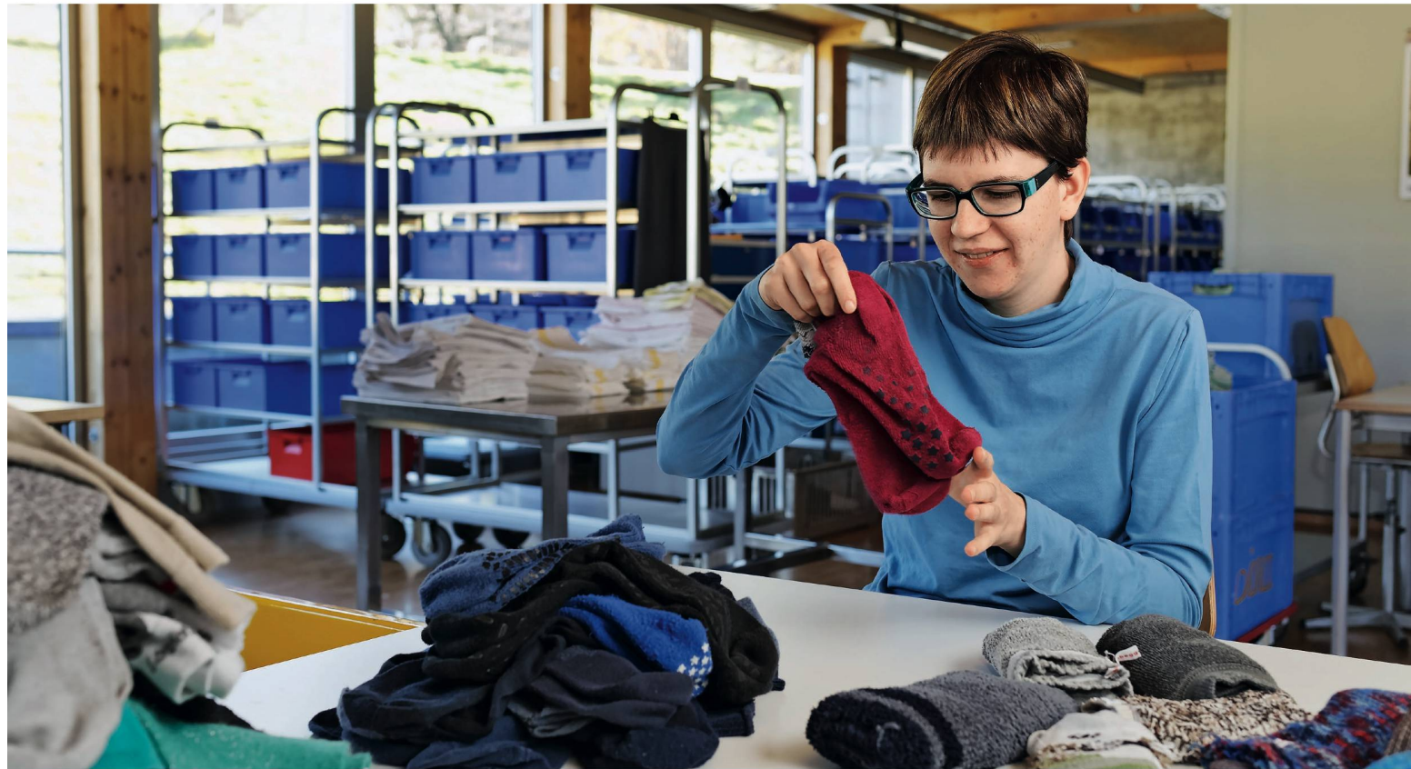
Sockenpaare finden vom einen Stapel zusammen; sorgsam vereint türmen sie sich auf einem anderen und gelangen, dank moderner Software, in die Schränke ihrer Besitzerinnen und Besitzer zurück: «Eine logistische Herausforderung.»