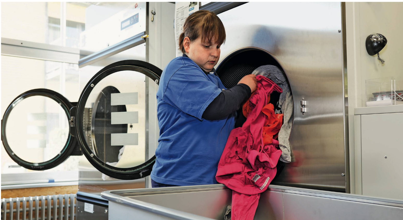
Die Mitarbeiterin leert eine von vier grossen Waschmaschinen. Jede fasst 50 Kilogramm Wäsche. Pro Tag werden eineinhalb Tonnen schmutzige Textilien sauber.