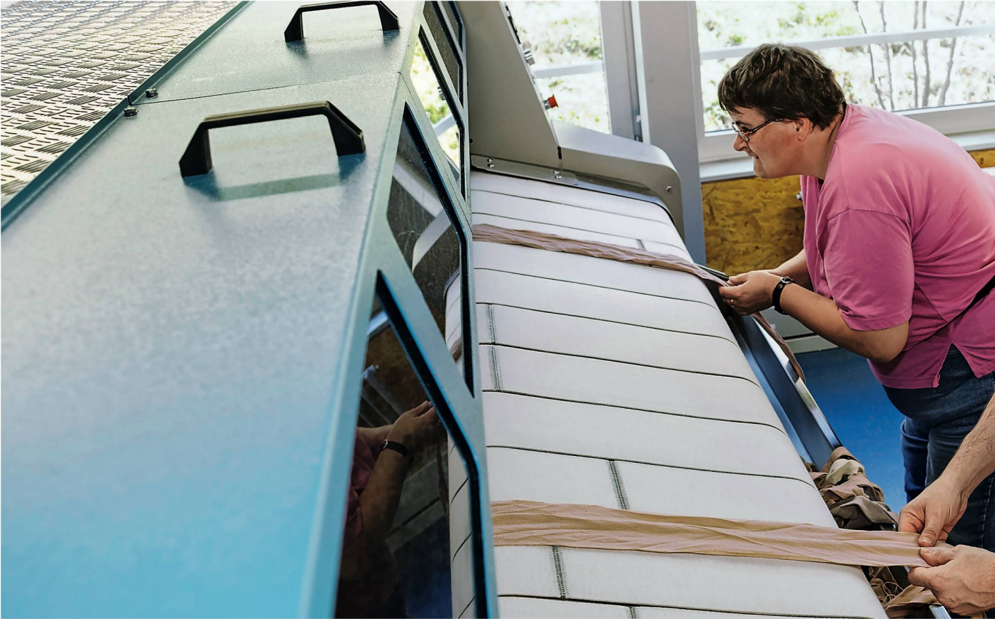
Wenn die Wäsche sauber und trocken ist, beginnt die Handarbeit. In den beiden oberen Etagen des Wäschereigebäudes werden die Kleider