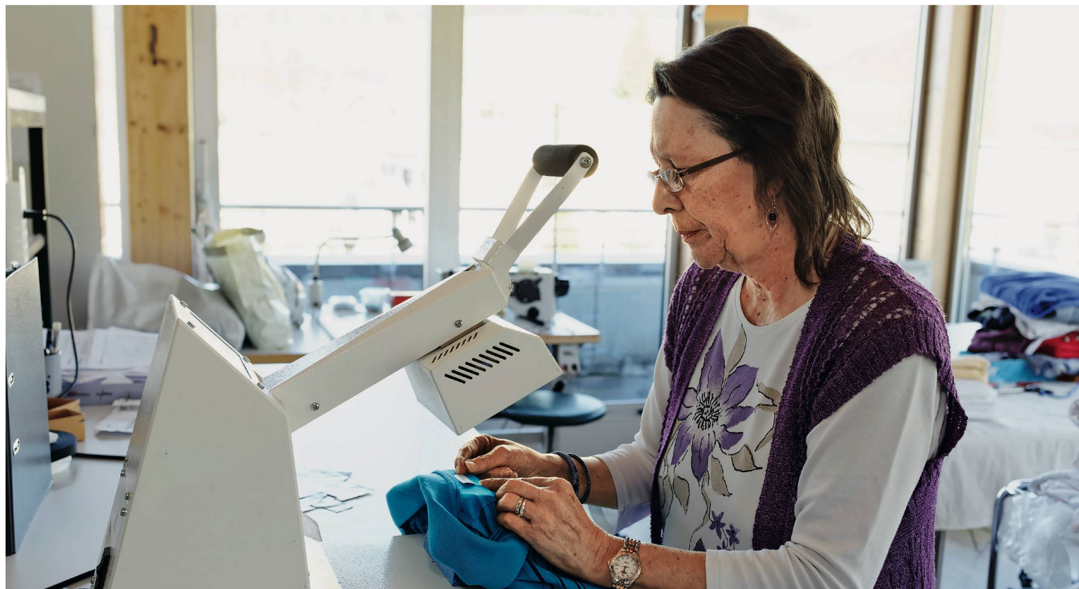
In jedes Kleidungsstück wird die Etikette mit den Personalien der Besitzer unter Druck und Hitze eingeklebt. Eine Mitarbeiterin legt die Etikette in die Innenseite des Kragens und schiebt sie unter eine Presse.