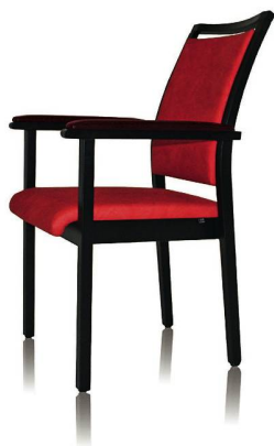
Alterszentrum Willisau Stuhlmodell LH56 und LH59

Viele Details aus der Care-Kollektion von Längle Hagspiel erleichtern das lange Sitzen für ältere Menschen: