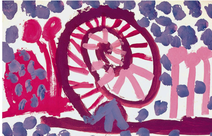
Aus dem Kritzelknäuel entwickelt sich die Spirale: Eine Richtung wird entdeckt, Absicht wird möglich.

ben grosse Bilder gemalt. Manchmal standen sie sogar auf in ihren Rollstühlen, um den oberen Rand des Bildes zu erreichen. Andere lagen bäuchlings auf Liegebrettern, hatten eine Farbpalette neben sich und zeigten mir, welche Farbe sie möchten, und ich gab ihnen den Pinsel mit der gewünschten Farbe – so malten sie wie die Könige.