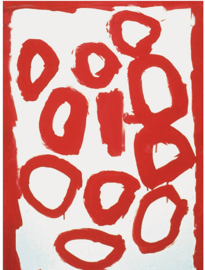
Irgendwann trifft die Richtung auf ihren Anfang, die Form wird geschlossen.