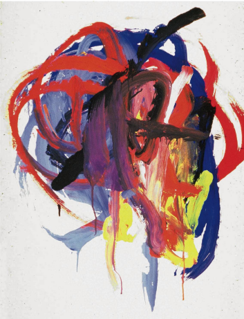
Die ersten Körperbilder werden rein motorisch kreisend gesteuert. Es entstehen Kritzelknäuel.