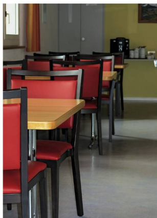
LH07 mit Griffleiste, Knierolle und Knaufarmlehne

Längle Hagspiel produziert seit über 60 Jahren Stühle, Tische und Bänke aus Massivholz. Besonderes Know-how haben wir uns im Pflege- und Carebereich angeeignet. Funktionalität, Ergonomie und Komfort unserer Produkte werden von den Bewohner/innen, den Angehörigen und vom Pflegepersonal geschätzt.