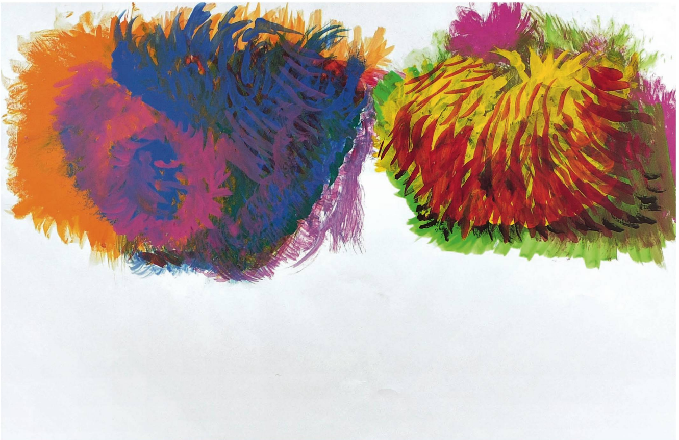
«Zotteln»: Gegen das Lebensende hin werden die Bilder leuchtender: Aus der Online-Ausstellung «Heimfinden zu den Urformen».