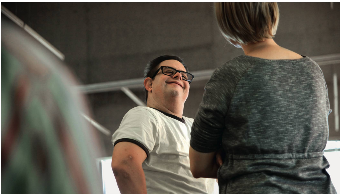
Gerade auch im Theaterworkshop können Menschen mit einer Behinderung ihre Persönlichkeit ausspielen.

Ein Kernelement der personenzentrierten Arbeit im AWZ sind die «persönlichen Lagebesprechungen», die die früheren «Förderplanungen» ersetzen. Im Vorfeld dieser Besprechungen werden die Bewohnerinnen und Bewohner aufgefordert, sich über ihre Wünsche Gedanken zu machen. Diese Überlegungen bilden die Grundlage für das individuelle Gespräch. Die Protokollierung dazu ist in kurzen verständlichen Sätzen gehalten, >>