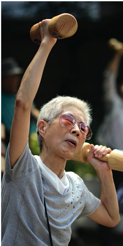
Seniorenfitness in der Welt gibt es in einem Park in Tokio: Dank einer der höchsten Lebenserwartungen Japan immer mehr Alte.

Lieber im Wohlfühlghetto am Stadtrand leben als in einem Mehrgenerationen-Projekt.