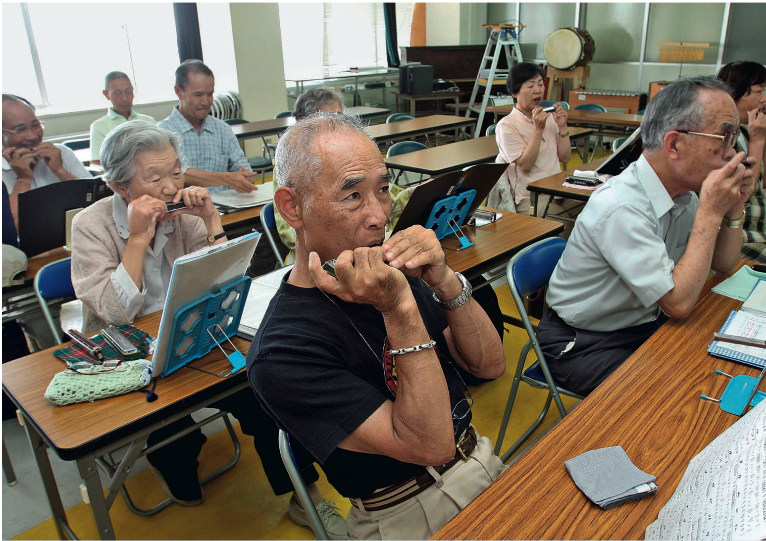
Japanische Senioren im Mundharmonika-Kurs: «Durch ein aktives Leben bleiben die Alten fit und sozial vernetzt.»