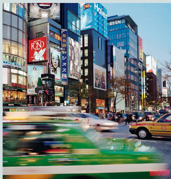
Strassenverkehr in Tokio: Erhöhtes Risiko wegen der alten Autofahrer.

In der rasant älter werdenden Gesellschaft Japans nimmt auch das Risiko durch ältere Autofahrer zu. Fünf Millionen Autolenker, die auf den Strassen Japans unterwegs sind, sind über 75 Jahre alt. Zwar muss diese Altersgruppe seit Kurzem in regelmässigen Abständen einen Test bestehen, um den Führerschein behalten zu können. Trotzdem verursachen die Alten immer mehr Unfälle. Ein Bestattungsunternehmen wartet nun mit einer neuen Präventionsidee auf. Senioren, die freiwillig ihren Führerschein abgeben, bekommen einen Rabatt von 15 Prozent auf ihre Beerdigungskosten.