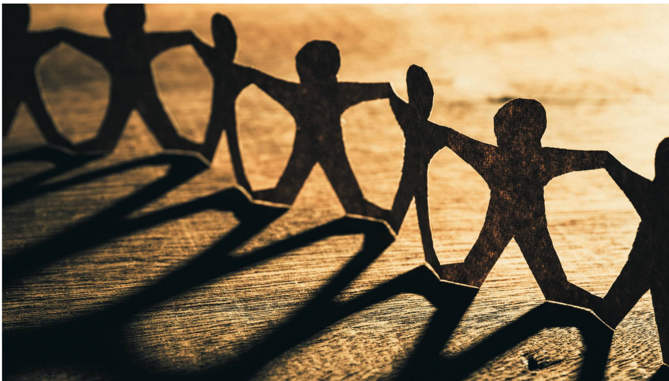
Buurtzorg: Ein Netz von Fachpersonen aus den Bereichen Pflege und Betreuung sowie Menschen aus dem sozialen Umfeld kümmern sich um das Wohl betagter Menschen. Sie achten dabei auf die Stärkung der Ressourcen ihrer Klienten.

In einer Studie aus dem Jahr 2014 formuliert die Ökonomin Mascha Madörin sehr pointiert und provokant, dass ihrer Meinung nach das schweizerische Pflegewesen im Vergleich zu den Niederlanden unterfinanziert und überreguliert sei. Es bestünde ein enges Kostenkorsett, das Einschränkungen der Pflegequalität nach sich ziehe. Die bestehenden Tarifsysteme seien demnach «überstandardisiert» und zu rigide. Daraus folgten Über- und Fehlregulierungen in der Pflegearbeit.