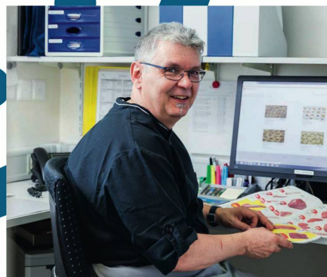
Alles aus einer Hand

Transgourmet Schweiz AG Lochackerweg 5 3302 Moosseedorf Kundencenter: 0848 000 501 www.transgourmet.ch/care