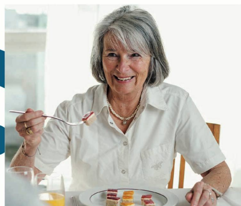
Küchenfertige Produkte Convenience Lösungen