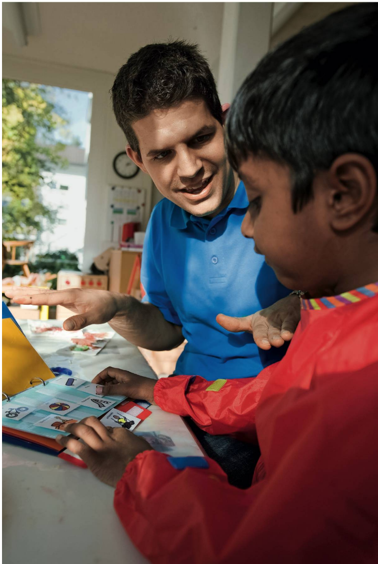
Zivis unterstützen Kitas und Schulen bei der Betreuung von Kindern und Jugendlichen.