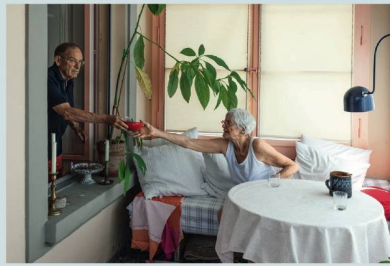
Hausgemeinschaft «Füfefüfzg» in Bern: Autonom, aber nicht allein.

Die neueste Ausgabe der Architektur-Fachzeitschrift «werk» beschäftigt sich schwerpunktmässig mit dem Thema «Wohnen im Alter». «Ist Alterswohnen wirklich so anders?», fragt allerdings Chefredaktor Daniel Kurz im Vorwort zur Ausgabe. Eigentlich nicht: «Für die allermeisten älteren Menschen ist es nichts anderes als das Gewohnte: den Tag verbringen, lesen, Hobbys pflegen, Freunde empfangen, ausgehen.» Trotzdem: Es ist auch anders. Viele ältere Menschen leben allein – «nach dem Ende der Familienzeit, vielleicht dem Tod des Partners». Dazu kommen kleinere und grössere Einschränkungen, abnehmende Mobilität und damit die Frage: Wie lange kann ich noch selbstständig wohnen? «werk» zeigt, dass es Wohnformen gibt, die das autonome Wohnen ausserhalb der Institutionen möglich machen. Es sind gemeinschaftliche Wohnformen in hindernisfreien Räumen, mit geeigneter Grösse