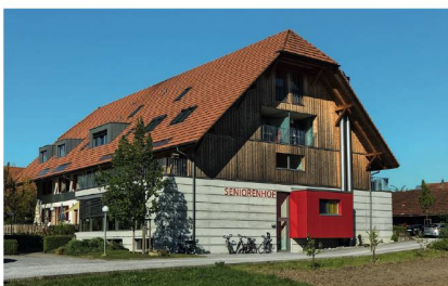
Seniorenhof Iffwil: Mehr als ein Heim.

richterhof» ist individuell gestaltbar und richtet sich nach den Bedürfnissen der Bewohner. Der Seniorenhof Iffwil bietet nebst 18 Pflegeheimplätzen auch Angebote für Betreutes Wohnen sowie Betreuungsangebote für Tagesgäste und Mittagsangebote für Senioren aus dem Dorf. Die Bewohner leben in grosszügigen Einzelzimmern oder in Seniorenappartements für ein oder zwei Personen, mit oder ohne Kochmöglichkeit. Der Seniorenhof Iffwil erfreue sich, sagen die Verantwortlichen, «seit seiner Eröffnung im Jahr 2012 einer ungebremsten hohen Nachfrage, nicht nur von Senioren, sondern auch von Kinderspielgruppen, Schulklassen, Besuchern und der gesamten Dorfbevölkerung».