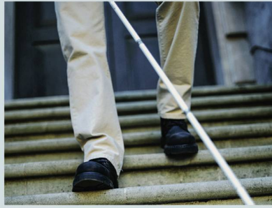
Sehbehinderung: Vielfalt von Situationen.

In der Schweiz leben gegen 380 000 Menschen mit Sehbehinderung, Blindheit, Hörsehbehinderung oder Taubblindheit – weit mehr, als bislang vermutet wurde. Zu diesem Ergebnis kommen die neuesten Berechnungen des Schweizerischen Zentralvereins für das Blindenwesen SZBLIND. Mit einem Fachheft sollen die Sehenden sensibilisiert werden und «einen Blick auf die Vielfalt der Situationen dieser Menschen werfen». Von den rund 377 000 betroffenen Personen sind etwa 50 000 blind, das heisst, sie können in den meisten täglichen Situationen kein Sehpotenzial nutzen. Der übrige, weit grösste Teil von Menschen mit Sehbehinderung nutzt – wenn es die äusseren Umstände erlauben – ein noch vorhandenes Sehvermögen. Etwa 57 000 Personen leben gleichzeitig mit einer Hörbehinderung. Damit entsteht eine Situation, die Hörsehbe-