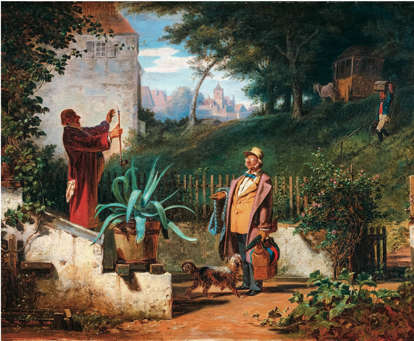
Carl Spitzweg: «Die Jugendfreunde» (um 1855), Öl auf Leinwand, 30×42,5cm: Was sagt die hohle Hand über die Freundschaft?