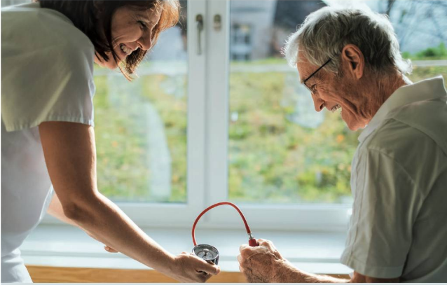
Übungen zur Kräftigung der Handmuskeln: Mit «Do-Health-Gruuven» kann man gezielt trainieren.

erwachsene Menschen. Jeder Gruuve legt den Fokus auf einen bestimmten Schwerpunkt, der zu Beginn des Gruuves eingebildet wird. So kann man beispielsweise gezielt Wirbelsäulendrehungen ausüben oder die Handkraft trainieren. Alle können gruuvn – die kurzen Einheiten eignen sich aber besonders für ältere Menschen oder jene, die nicht die Kraft oder nicht genügend Vertrauen in ihr Gleichgewicht haben für