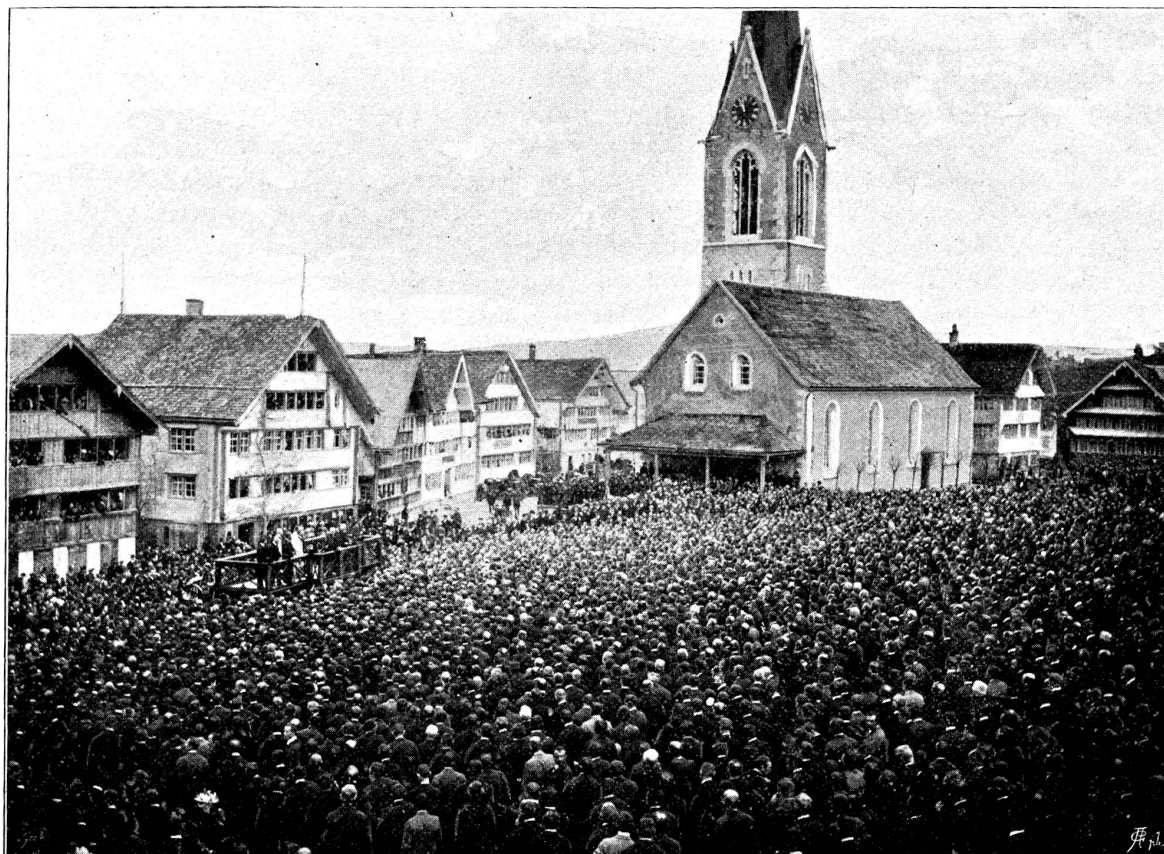
Landsgemeinde in Gumbühl (Appenzell A. Rh.) 1897. (Siehe S. 58 u. f. f.)

Der Vollenweider war es auch, welcher Tiesel nach geschehener Begräbnis das freundliche, väterliche Anerbieten machte: 'Zieh' Du mit mir nach Haus', Mädchen! Ich und meine liebe Alte können Deine vortrefflichen,